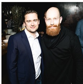
РЕСТОРАН SELFIE — В ТОП-100 ЛУЧШИХ РЕСТОРАНОВ МИРА