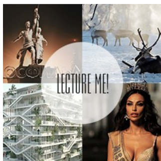
LECTURE ME! КАЛЕНДАРЬ ЛЕКЦИЙ — НЕЙРОБИОЛОГИЯ ПРИВЫЧЕК, ЯКУТСКИЕ КОНЕВОДЫ И КИНО ГЛАЗАМИ ФОТОГРАФА