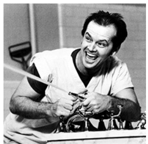
ЧТО ПОСМОТРЕТЬ В ВЫХОДНОЙ: ФИЛЬМЫ С ДЖЕККОМ НИКОЛСОНОМ