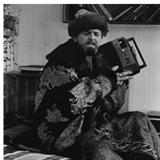
LECTURE ME! КАЛЕНДАРЬ ЛЕКЦИЙ: ОРХАН ПАМУК, «ЗВЕЗДНЫЕ ВОЙНЫ» И «МОРОК БЕЗЫМЯННОСТИ»